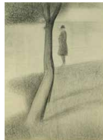
Afbeeldingen: van links naar rechts / Images: from left to right Georges Seurat, La grève du Bas-Butin à Honfleur , 1886, Musée des Beaux-Arts, Tournai; Georges Seurat, Le Cirque , 1890-1891, Musée d'Orsay, Parijs; Georges Seurat, Arbre et homme (Homme au bord de l'eau) , c. 1884, Von der Heydt-Museum, Wuppertal; Georges Seurat, Port-en-Bessin, un dimanche , Kröller-Müller Museum, Otterlo; Théo Van Rysselberghe, Le 'Per-Kiridy' à marée haute , 1889, Kröller-Müller Museum, Otterlo